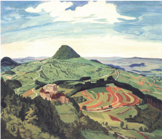
1 Erich Heckel (1883–1970), Der Hohenstaufen , 1935 Tempera auf Leinwand, Leihgabe des Landes Baden-Württemberg

Das Künstlerpaar Katharina Krenkel und O.W. Himmel setzt im jungen kunstraum in einer Riesencollage Kunstwerke aus dem Museum und eigene Werke in Szene. Dabei erwacht Vergängliches oder scheinbar Unbrauchbares zu neuem Leben und wird als Kunstwerk unsterblich: Äpfel, Pflaumen und Bananenkisten, Bücher, Holz, alte Schallplatten, Konservendosen, Schokoladenpapier, Blätter, Videoband, Wolken, Wollreste und vieles mehr.